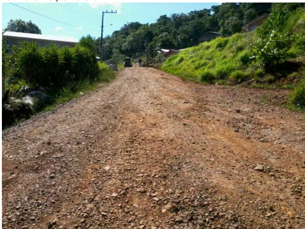
Rua Ivonei Roque Fiorentin

As ruas, objeto do presente projeto, encontram-se pavimentadas com revestimento primário (cascalho), a pavimentação em paralelepípedos torna-se indispensável e urgente pois existe nos referidos trechos das ruas uma situação de precariedade de acesso aos moradores, e, por ser um local de aclive, após cada chuva intensa as condições do leito de terra fica seriamente danificado, conforme fotos abaixo: