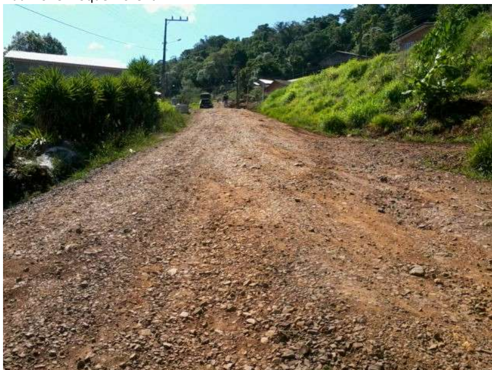
Rua Ivonei Roque Fiorentin

As ruas, objeto do presente projeto, encontram-se pavimentadas com revestimento primário (cascalho), a pavimentação em paralelepípedos torna-se indispensável e urgente pois existe nos referidos trechos das ruas uma situação de precariedade de acesso aos moradores, e, por ser um local de aclave, após cada chuva intensa as condições do leito de terra fica seriamente danificado, conforme fotos abaixo: