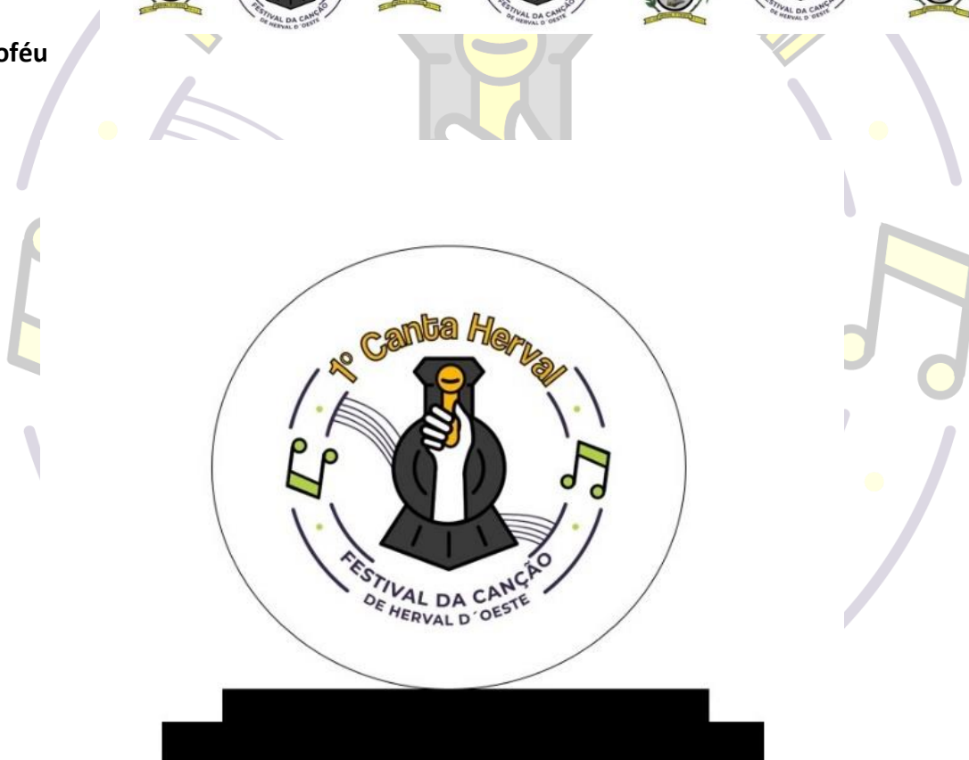
Modelo : Troféu