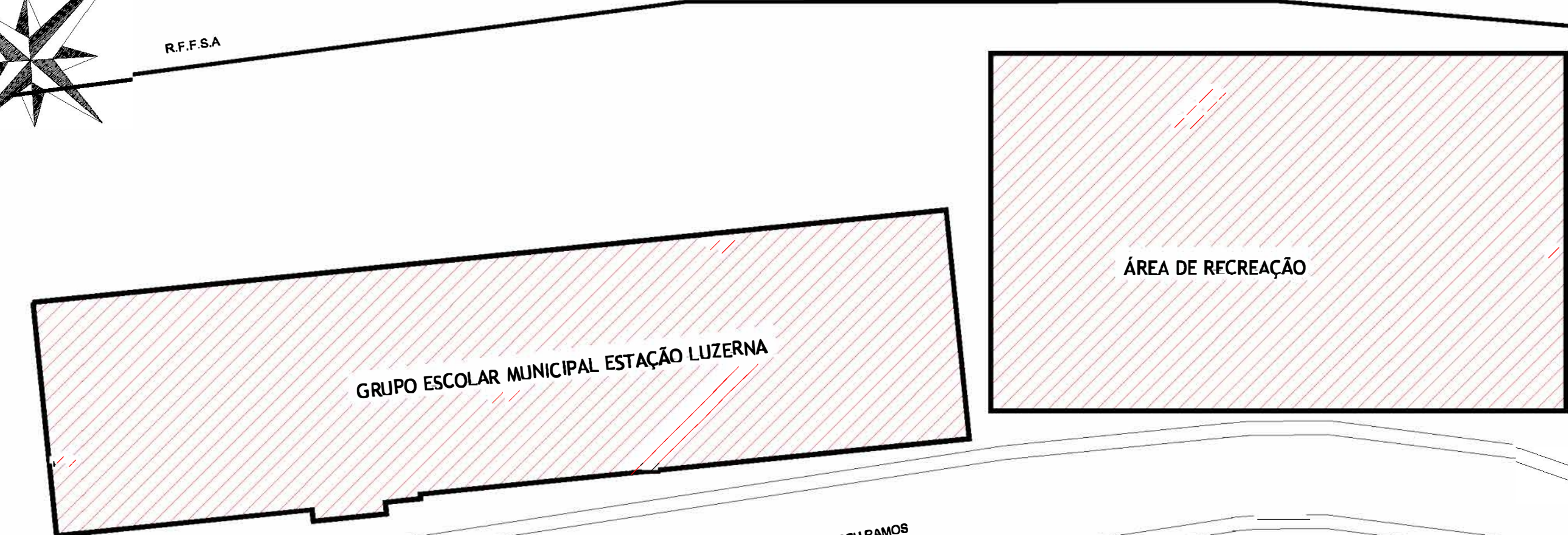
Planta de Localização Escala:1/250