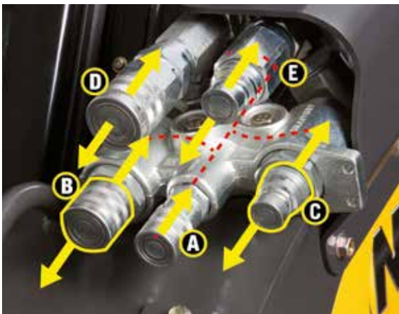
Auxiliares opcionais de alta vazão