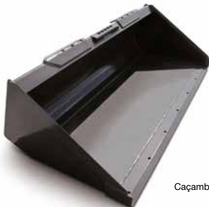
Caçamba de perfil baixo estendido