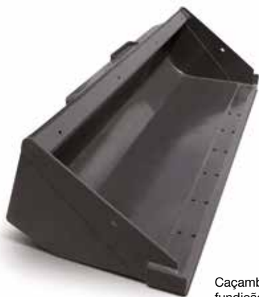
Caçamba HD para fundição e terra