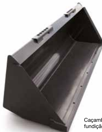
Caçamba para fundição e terra